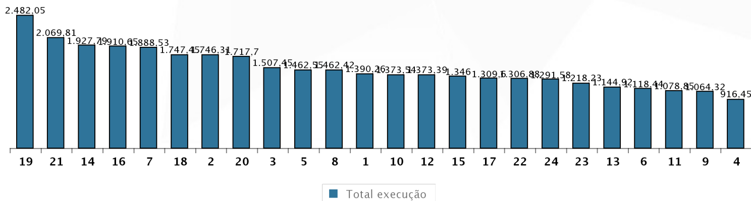
Gráfico – Prazo Médio na Fase de Execução por Região Judiciária – 01/01/19 a 31/07/19

Nota: Execução: Prazo Médio do início até o Encerramento da Fase de Execução.